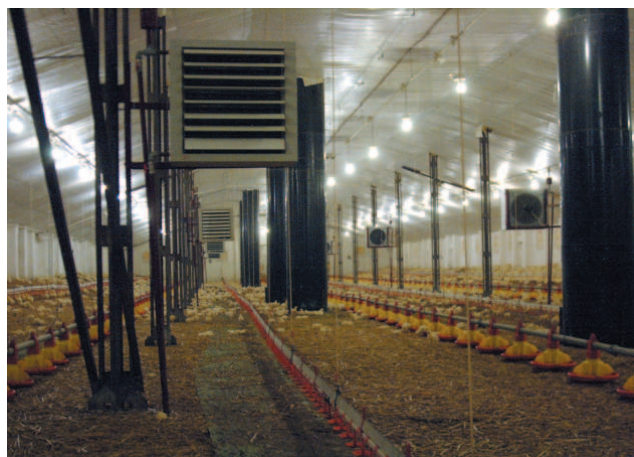
Ferma drobiu w Krzeczynie

stosowanych materiałów budowlanych (głównie płytach warstwowych) nabiera dużego znaczenia, gdyż ułatwia montaż. Warstwa epoksydowa pokrywająca wymiennik ciepła skutecznie chroni go przed szkodliwym działaniem amoniaku. Na wylocie powietrza z nagrzewnicy zamontowane są ręcznie regulowane kierownice, które umożliwiają odpowiednie kierowanie strugi nawiewanego powietrza w zależności od wysokości i sposobu montażu urządzenia.