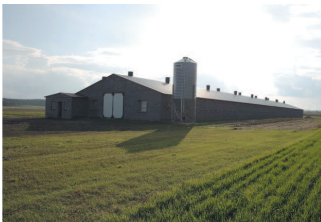
Ferma drobiu w Sieroszewicach